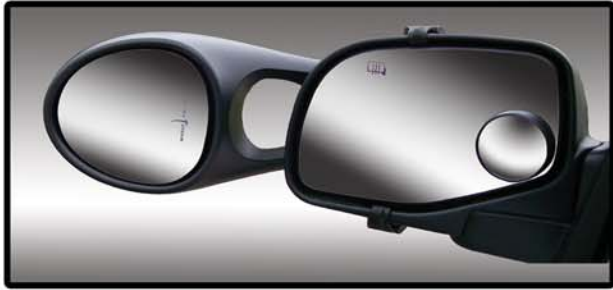
UTM Part #11960

Tow-N-Go Solutions, Inc. www.towngosolutions.com